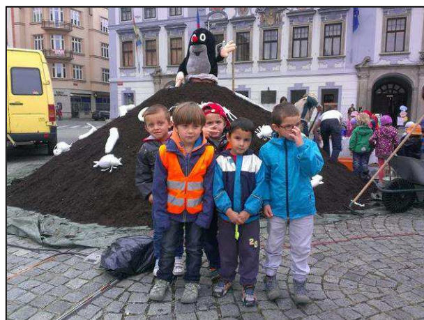
Obr. 4: Naučně – zábavná akce „Vesmír v půdě“