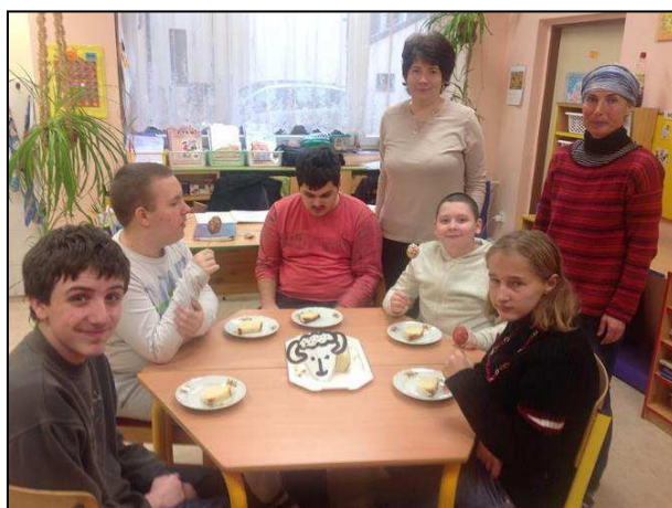
Obr. 18: Třída pro žáky s PAS