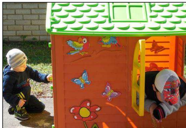
Obr. 20: MŠ speciální