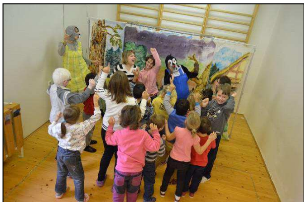
Obr. 7: Divadelní představení