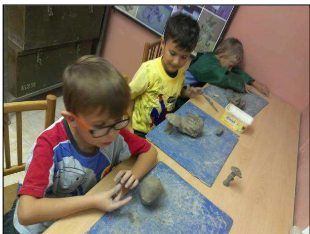
Obr. 9: V keramické dílně