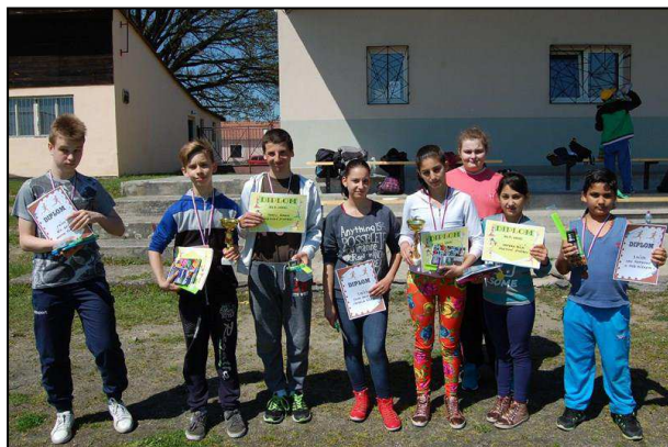
Obr. 8: Lehkoatletický čtyřboj