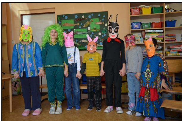
Obr. 13: Školní družina