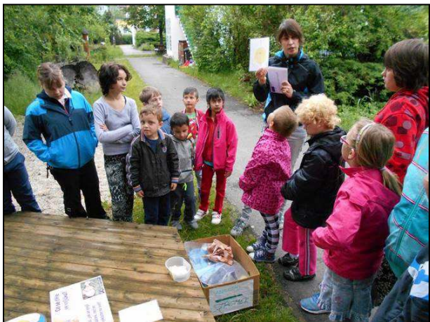
Obr. 3: V Centru ekologické výchovy Cassiopeia