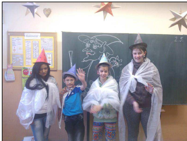
Obr. 16: ZŠ speciální