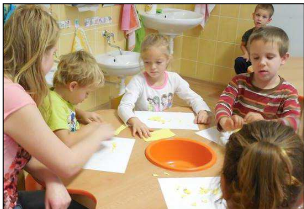
Obr. 19: MŠ speciální