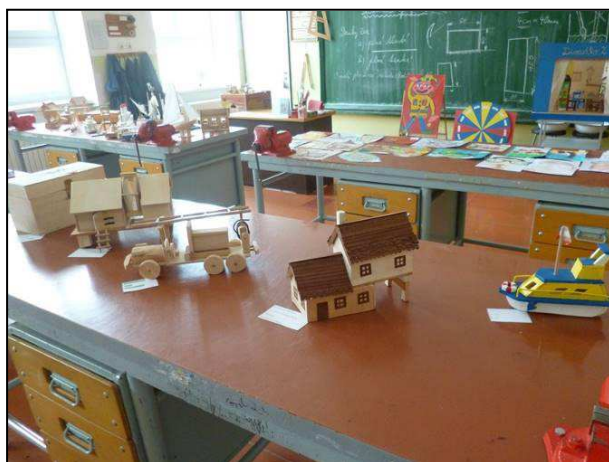
Obr. 10: Samostatná tvořivá činnost