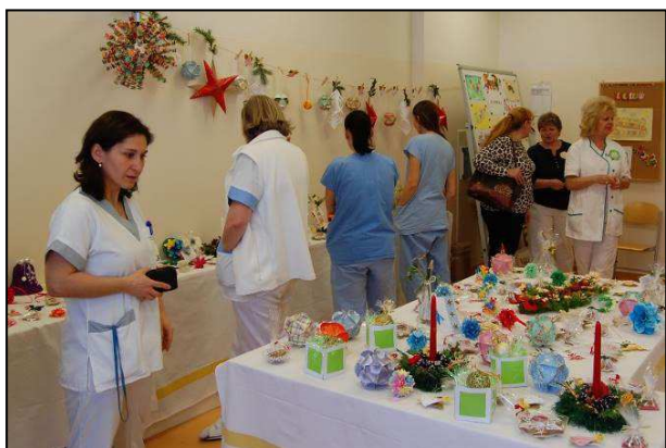
Obr. 11: Stonožka – výrobky dětí z MŠ a ZŠ při zdrav. zařízení