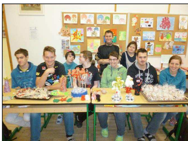
Obr. 24: Praktická škola dvouletá