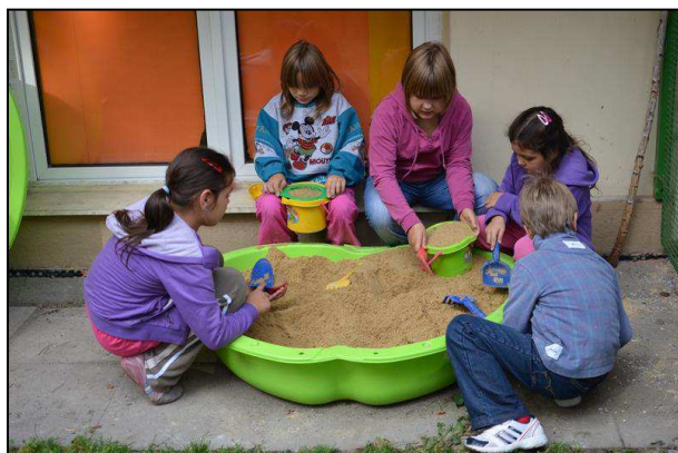
Obr. 14: Školní družina