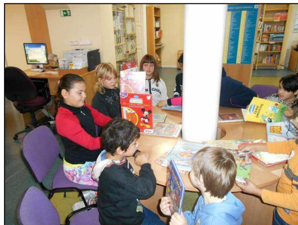
Obr. 2: Návštěva dětského oddělení Městské knihovny