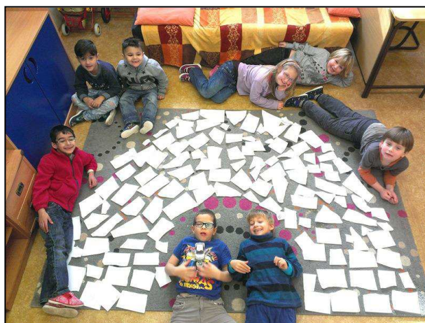
Obr. 22: Přípravná třída ZŠ