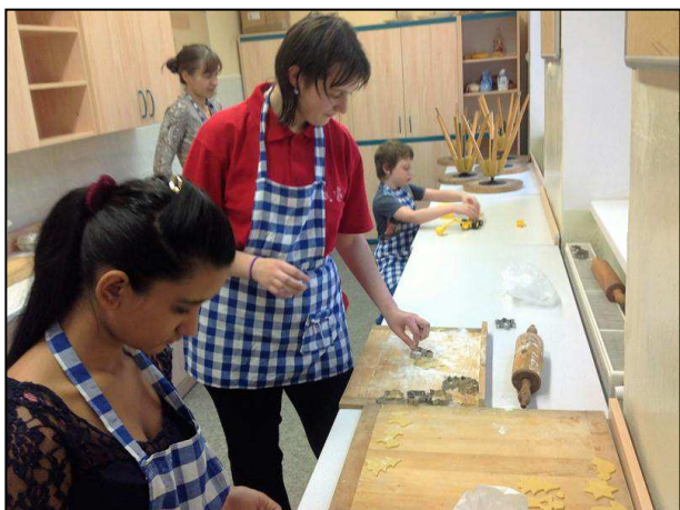
Obr. 15: ZŠ speciální