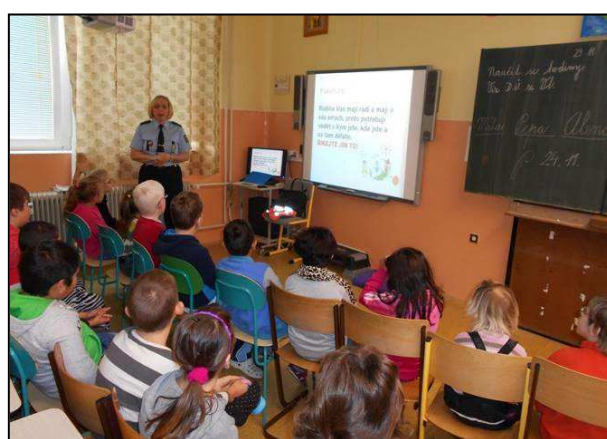
Obr. 6: Beseda s Policií ČR