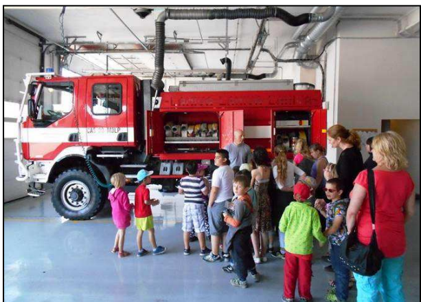
Obr. 5: Návštěva Hasičského záchranného sboru Jihočeského kraje