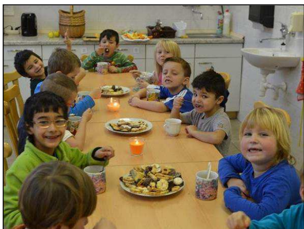
Obr. 21: Přípravná třída ZŠ