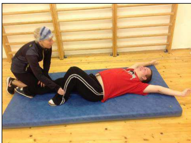
Obr. 17: Třída pro žáky s PAS