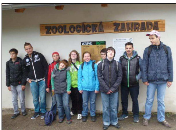
Obr. 23: Praktická škola dvouletá