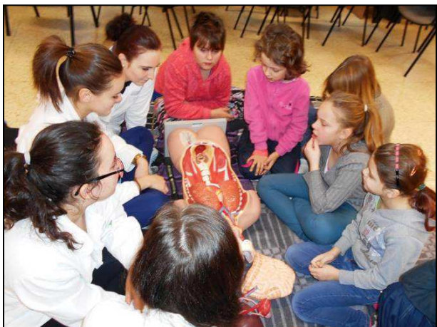
Obr. 1: Výchova ke zdraví se žáky SZŠ