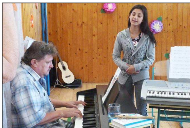
Obr. 12: Konvalinka – 15. ročník pěvecké soutěže