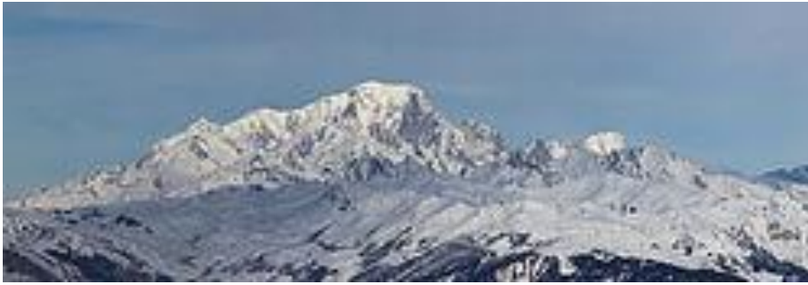
Alpy (Mont Blanc 4 810 m)