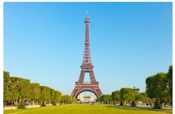
Eiffelova věž v Paříži