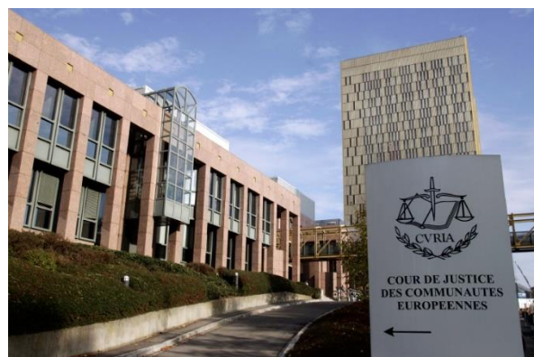
Evropský soudní dvůr v Lucemburku