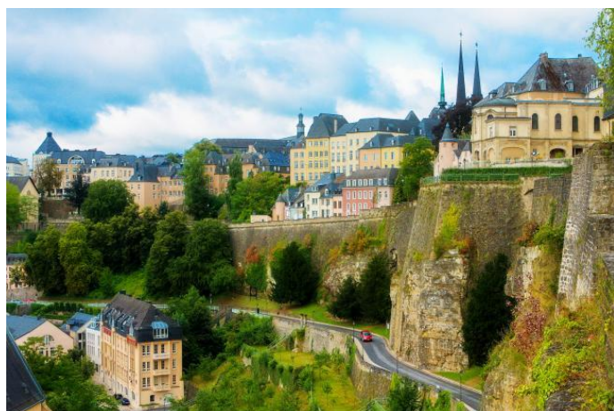
hlavní město Lucemburk