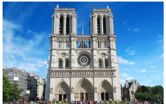
katedrála Notre Dame