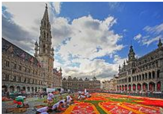
Grande - Palace v Bruselu