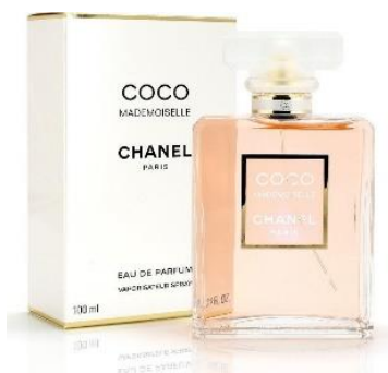
Parfém COCO CHANEL