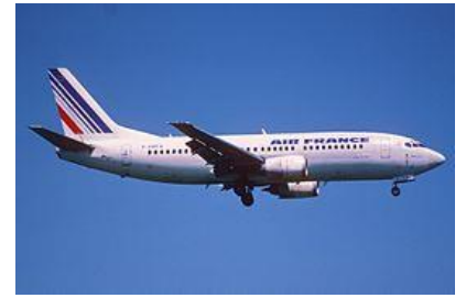
letadlo Air France