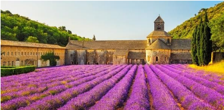
Provence (levandulová pole)