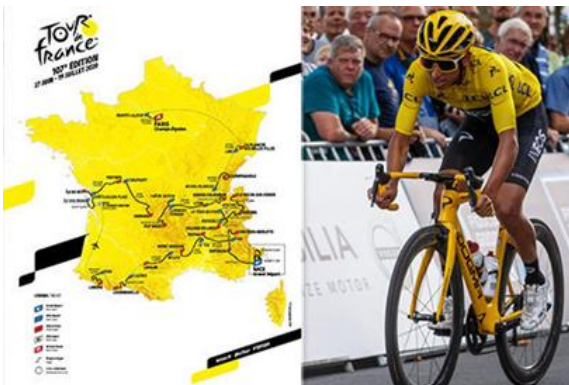
Tour de France