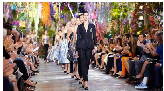
módní přehlídka v Paříži