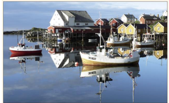
souostroví Lofoty na severu Norska

hlavní město: Oslo měna: norská koruna státní zřízení: monarchie