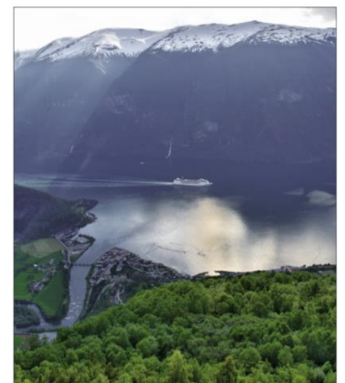
fjord – Sognefjord (Norsko)