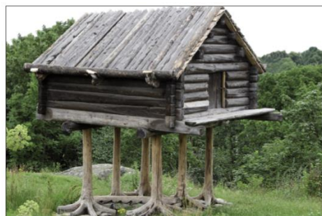
laponský sklad potravin – je postaven na vysokých nohách kvůli ochraně potravin před medvědy