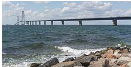
most přes Velký Belt