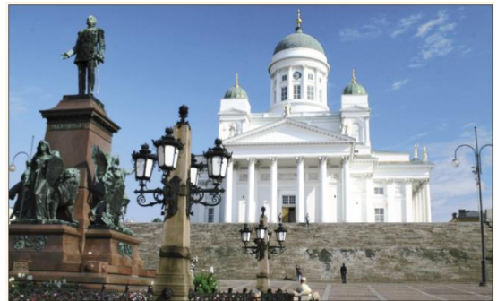
Helsinky – evangelická katedrála na náměstí Senaatintori