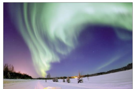
polární záře – částice slunečního záření způsobují v polárních oblastech nezvyklé světelné úkazy