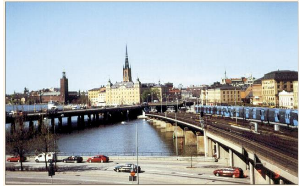
Stockholm – hlavní město Švédska