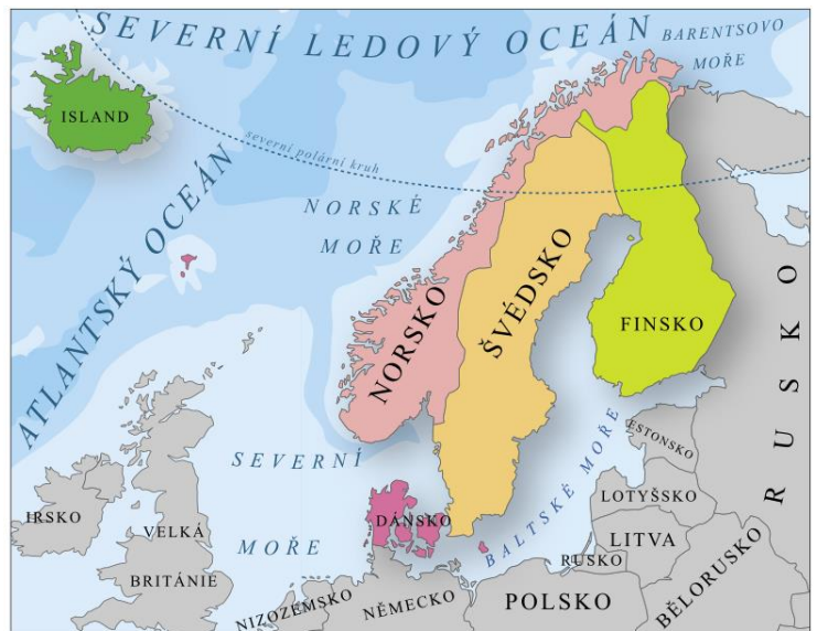
státy severní Evropy