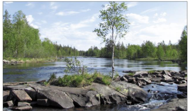
malebná krajina v jižním Švédsku