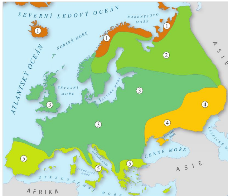
typy přírodních krajín Evropy