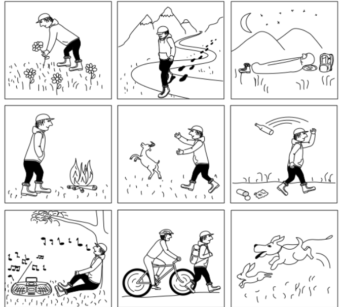
symboly zákazů v NP