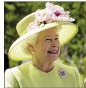
britská královna Alžběta II.