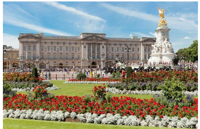
Buckinghamský palác v Londýně