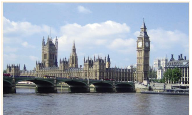
Londýn – britský parlament s věží Big Ben