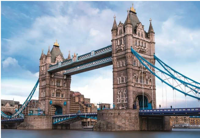
Tower Bridge – zvedací most v Londýně