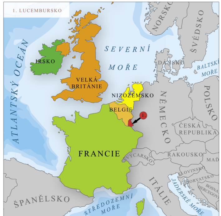
státy západní Evropy