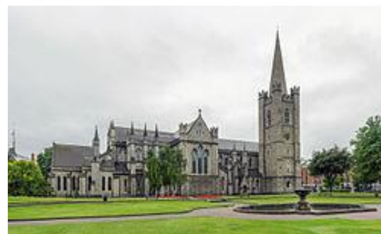
Katedrála sv. Patrika v Dublinu