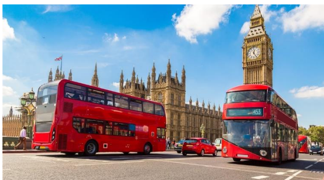
Duble decker bus