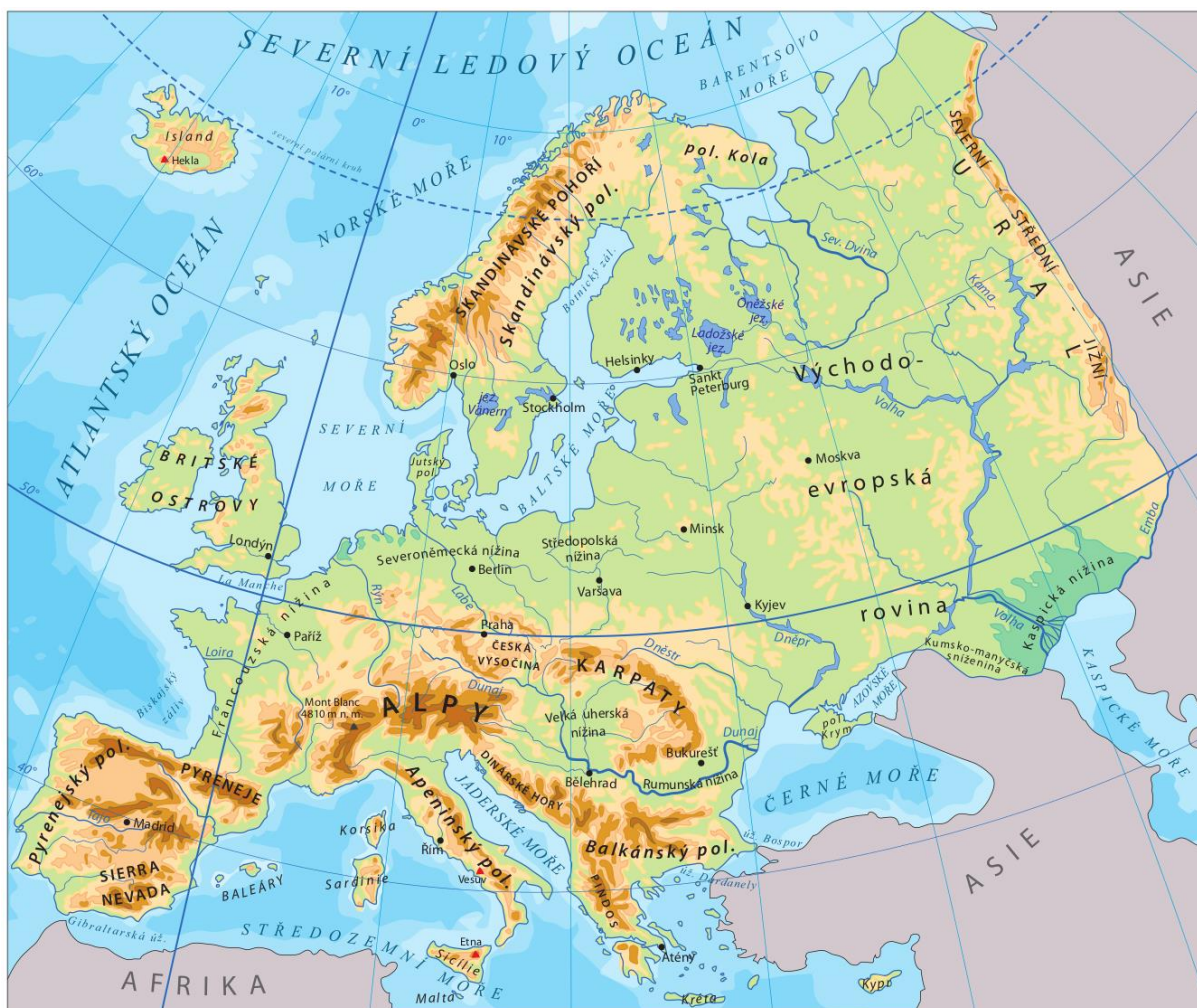
obecně zeměpisná mapa Evropy