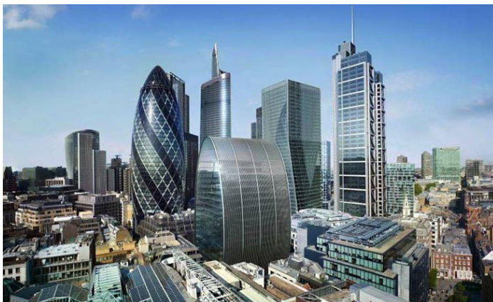
City of London – velké finanční centrum