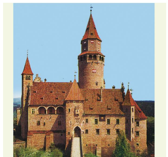
Bouzov – původně gotický hrad byl do dnešní podoby přestavěn v 19. století