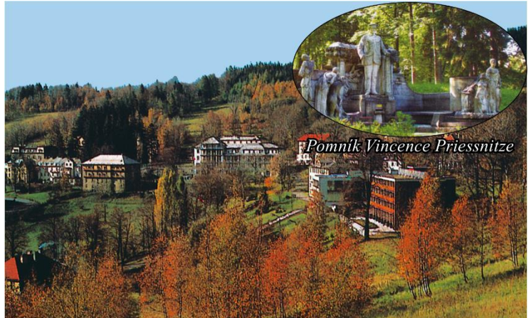
Pomník Vincence Priessnitze