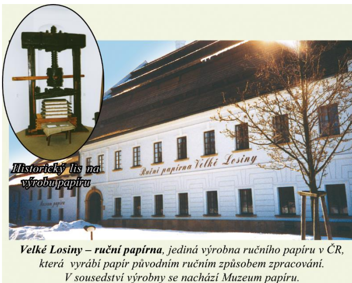
Historický lis na výrobu papíru