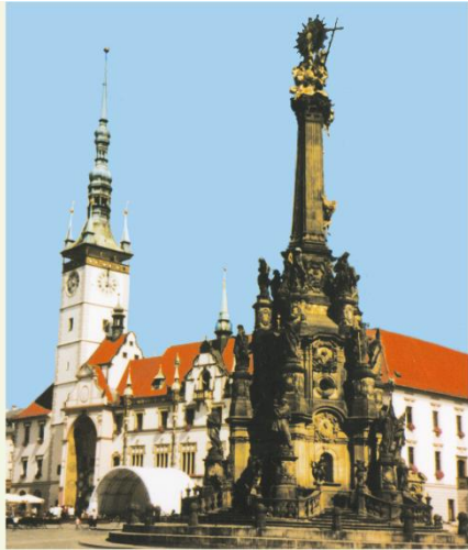
Olomouc – náměstí se sloupem Nejsvětější trojice, památka UNESCO