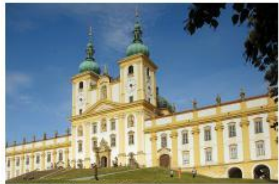
Bazilika Svatý kopeček v Olomouci