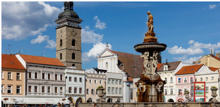
Obr. 1 České Budějovice