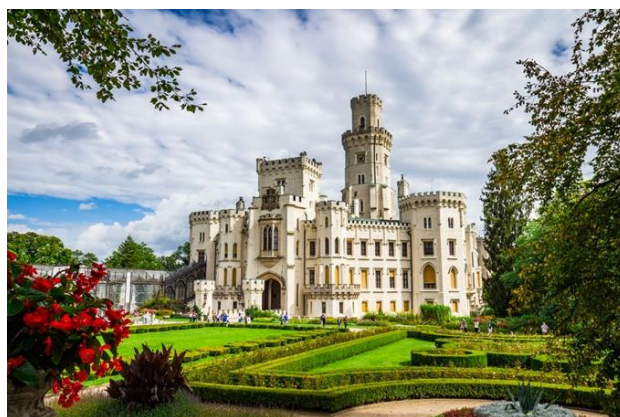
Obr. 2 zámek Hluboká nad Vltavou