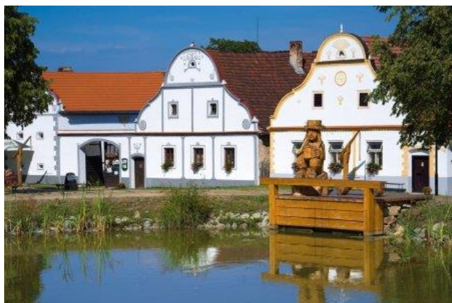
Obr. 3 stavby selského baroka v Holašovicích