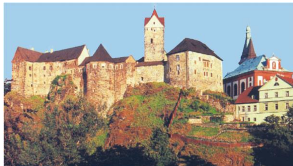
Loket – hrad se tyčí nad řekou Ohří (CHKO Slavkovský les)