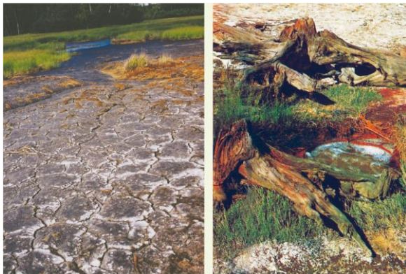
Soos – přírodní zajímavost nedaleko Františkových Lázní. Rašeliniště s vývěry minerálních vod a plynů jsou pozůstatkem sopečné činnosti.