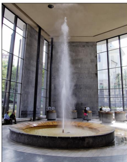
Vřídlo v Karlových Varech – nejteplejší pramen v ČR