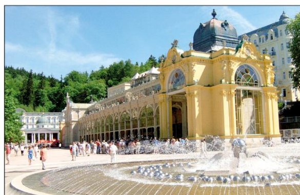
Mariánské Lázně – po Karlových Varech druhé nejvýznamnější lázeňské středisko u nás