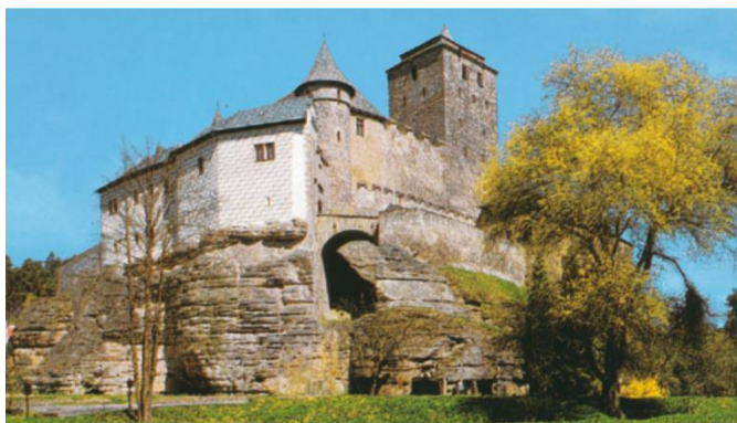
Hrad Kost (CHKO Český ráj)