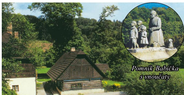
Pomník Babička s vnoučaty