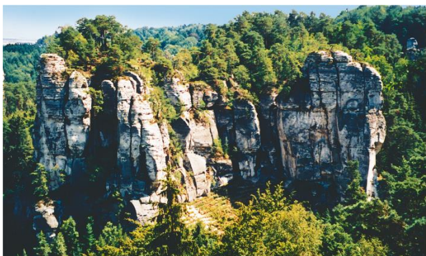
Prachovské skály (CHKO Český ráj). Nejnavštěvovanější „skalní město“ tvořené různě tvarovanými pískovci. Leží nedaleko města Jičín známého z pohádek o loupežníku Rumcajsovi.