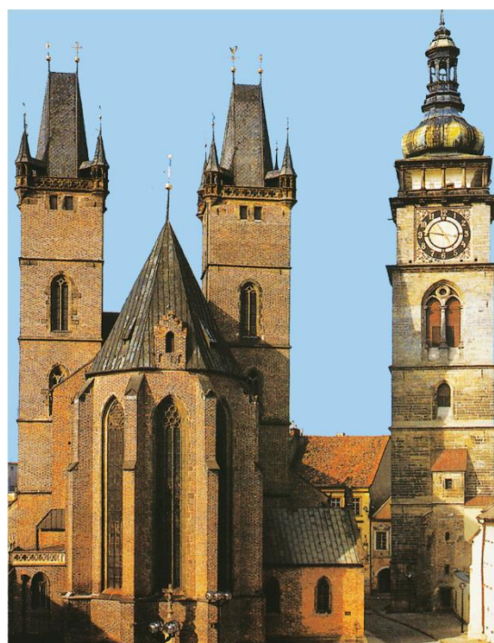
Hradec Králové – gotická katedrála sv. Ducha a barokní Bílá věž (postavena z pískovcových kvádrů)