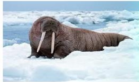
Mrož lední žije v Severním ledovém oceánu. Svými kly dokáže zabít i ledního medvěda.

Medvěd lední má výborný čich. Loví tuleňe, ryby a ptáky. Je to velice dobrý plavec. Bez potravy vydrží až 8 měsíců.