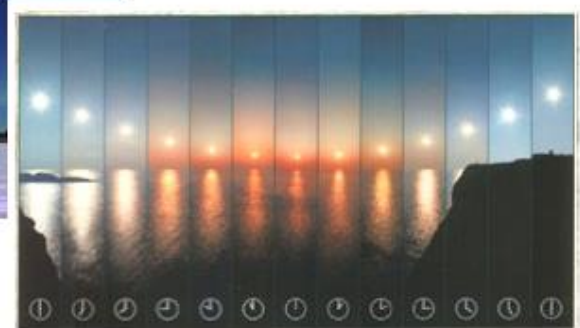
Polární den - Slunce nezapadá, svítí 24 hodin

Na pólech trvá polární den i noc půl roku.