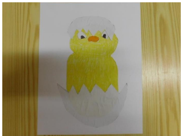
KUŘE VE SKOŘÁPCE