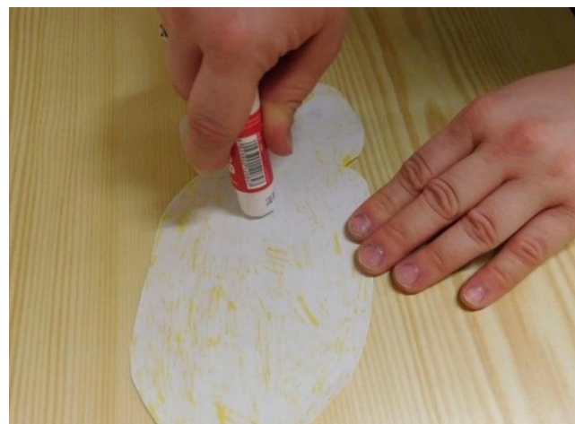
5.NANES LEPIDLO NA KUŘE