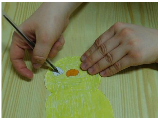
4.VYKRESLI OČI KUŘETE ČERNĚ