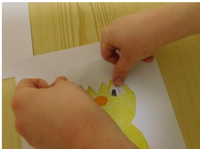
9. PŘILEP MENŠÍ SKOŘÁPKU KUŘETI NA HLAVU