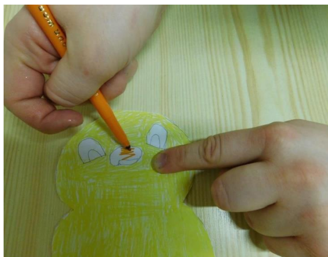
3. VYKRESLI ZOBÁK KUŘETE ORANŽOVĚ