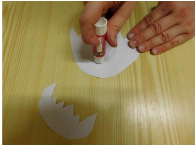
7. NANES LEPIDLO NA SKOŘÁPKY