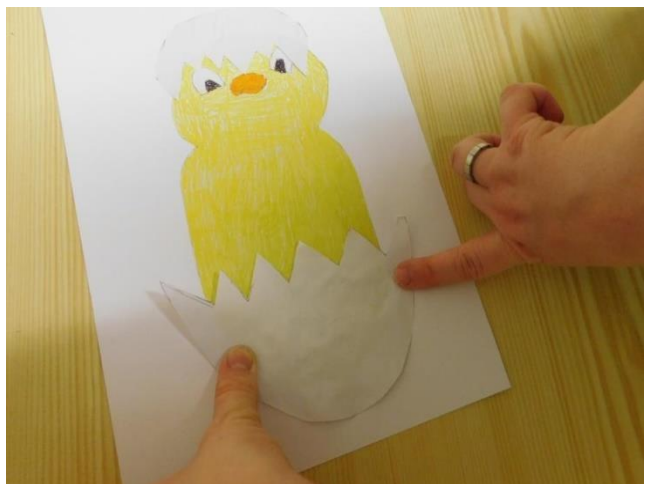
8. PŘILEP VĚTŠÍ SKOŘÁPKU NA KUŘE