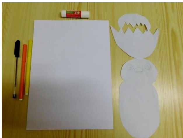
1. POMŮCKY – PAPIR, FIXY, LEPIDLO, ŠABLONA KUŘETE, SKOŘÁPKY