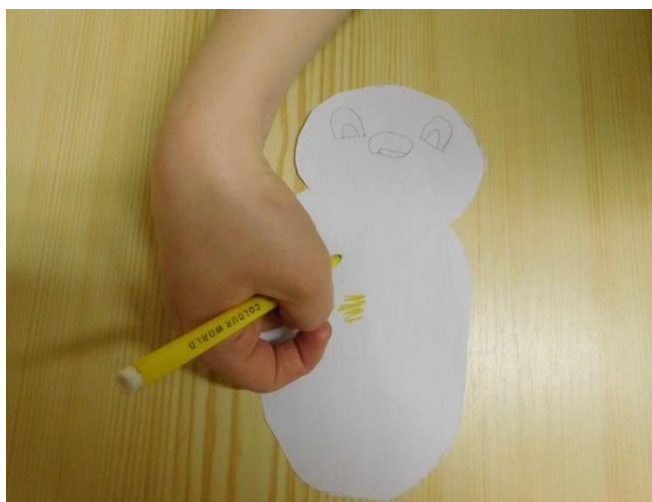
2.VYKRESLI KUŘE ŽLUTĚ