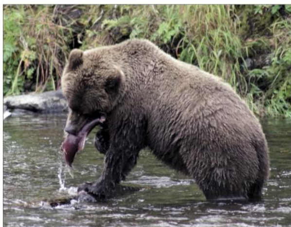
medvěd grizzly na lovu lososů (tajga)