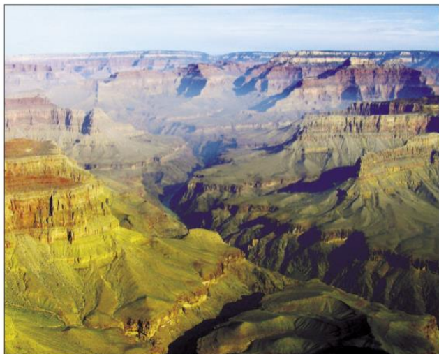
Grand Canyon [grænd kænjən] – největší kaňon na řece Colorado

Deset milionů let trvalo, než řeka Colorado vyhloubila největší říční údolí světa – Grand Canyon (Velký kaňon). Jeho délka je 350 km a největší hloubka 1 800 m.