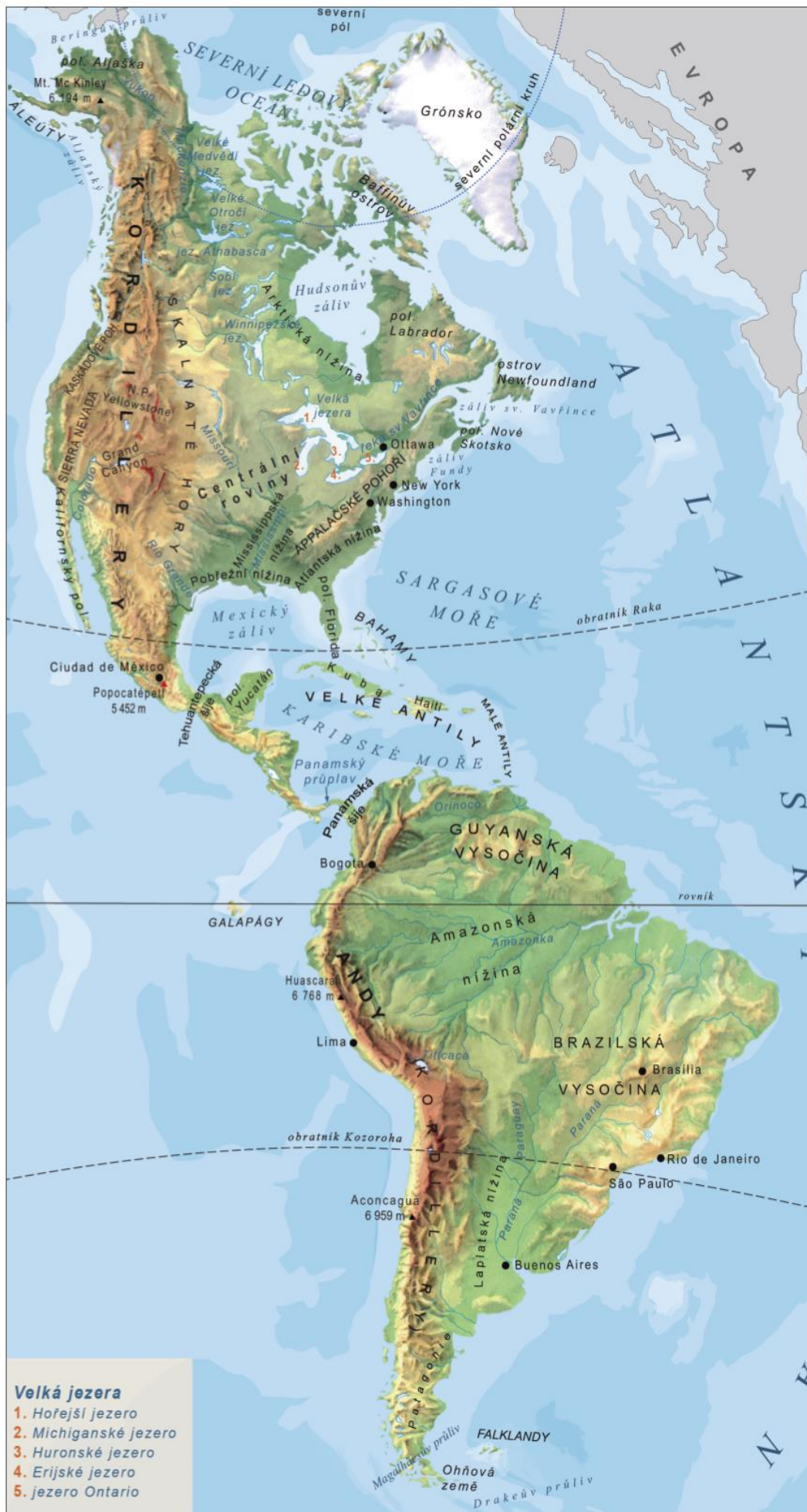
obecně zeměpisná mapa Ameriky