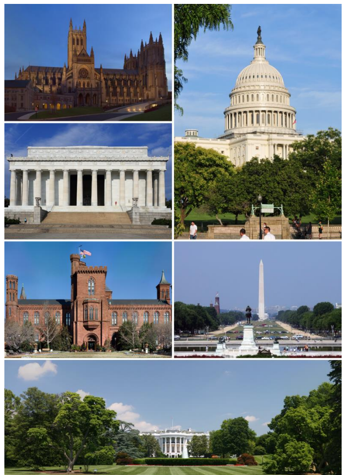
Washington, D.C. (USA)