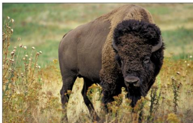
bizon na severoamerické prérii