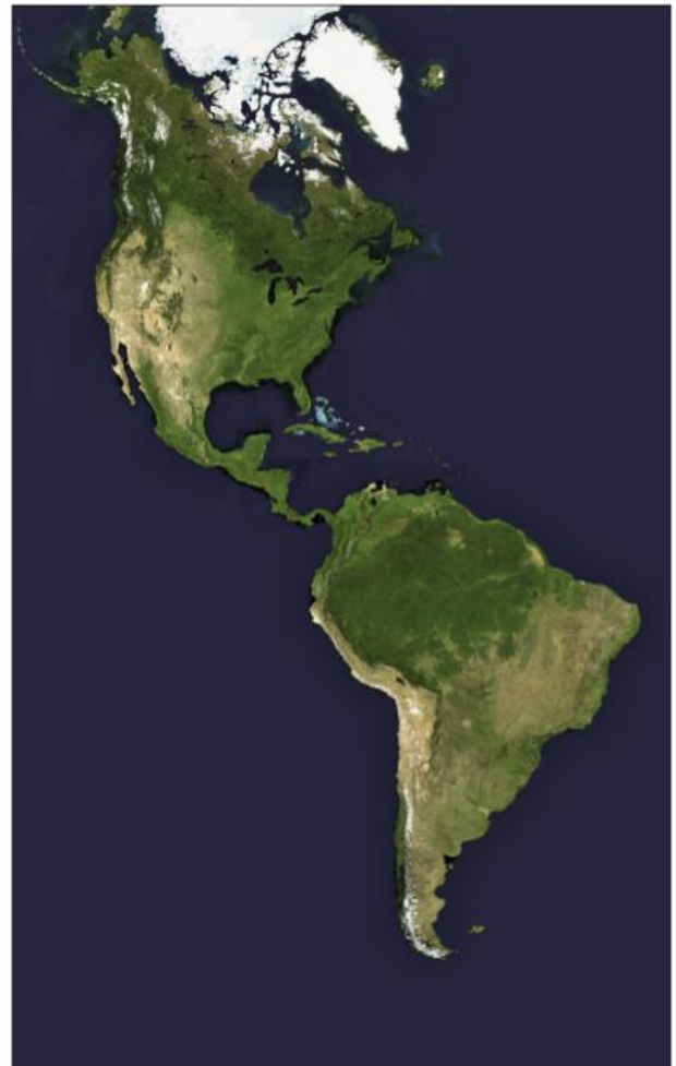
Amerika – satelitní snímek