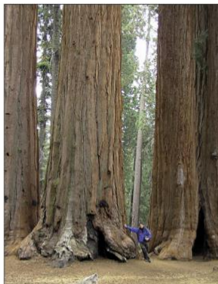
sekvojovec obrovský – nejmohutnější strom světa, výška až 89 metrů

Deset milionů let trvalo, než řeka Colorado vyhloubila největší říční údolí světa – Grand Canyon (Velký kaňon). Jeho délka je 350 km a největší hloubka 1 800 m.