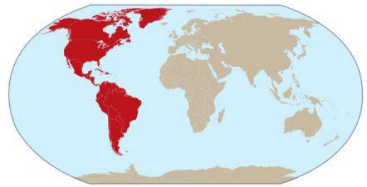
poloha Ameriky na mapě světa