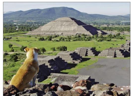
Teotihuacán [teotyukán] (Místo bohů) – zříceniny centra první mocné civilizace v Mexiku. V pozadí pyramida Slunce (vysoká téměř 70 m).