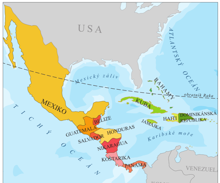
státy Střední Ameriky: ■ pevninské ■ ostrovní