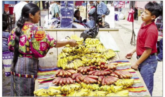
banány – typická plodina Střední Ameriky