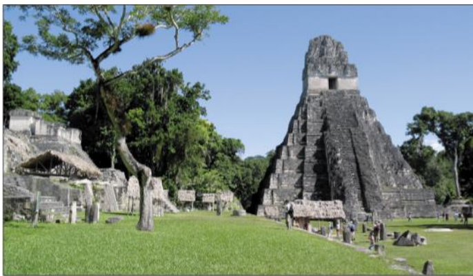
Guatemala – oblast Tikal s tzv. pyramidou jaguára – bývalé největší centrum mayské civilizace