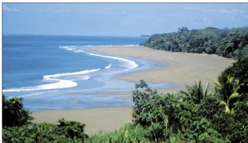
Kostarika – karibské pobřeží