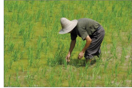
pěstování rýže – hlavní plodiny Číny