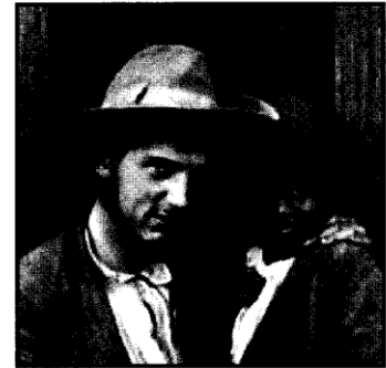
Vojtěch Frič (1882–1944) Kdo to byl?