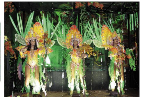
světově proslulý karneval v Rio de Janeiro