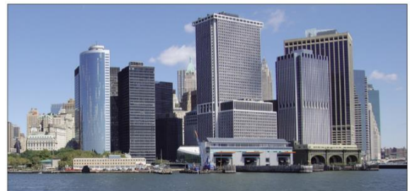
moderní velkoměsto (New York, USA)