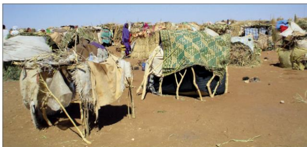
uprchlický tábor (Afrika)