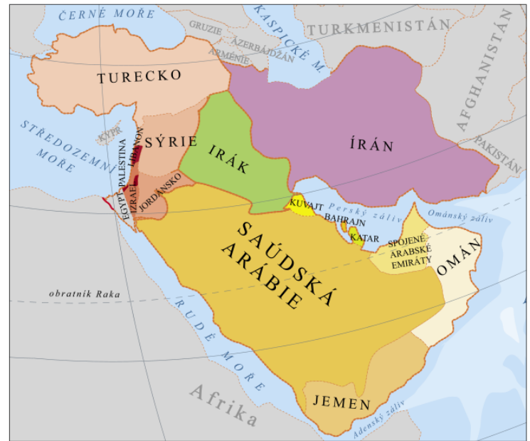
státy jihozápadní Asie