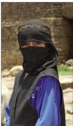
typické oblečení žen v Saúdské Arábii