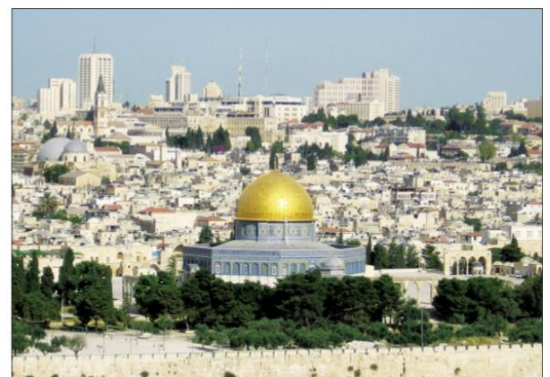
Jeruzalém – Skalní dóm na Chrámové hoře