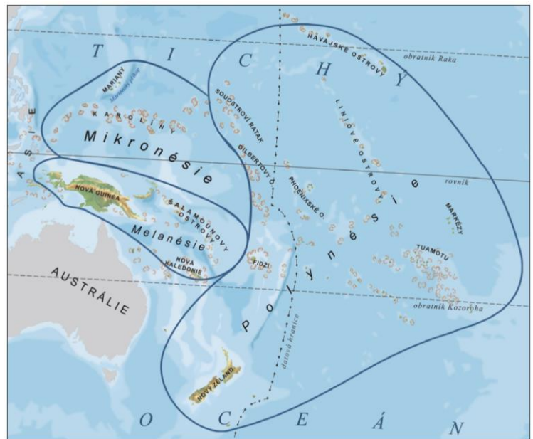
rozdělení Oceánie: Polynésie, Melanésie, Mikronésie