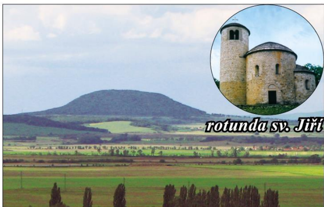
rotunda sv. Jiří

hora Říp – na vrcholu stojí rotunda sv. Jiří V roce 1868 byl z Řípu převezen základní kámen pro stavbu Národního divadla.