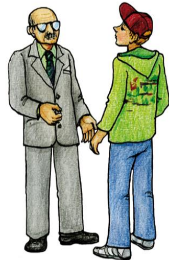
starší a mladší osoba