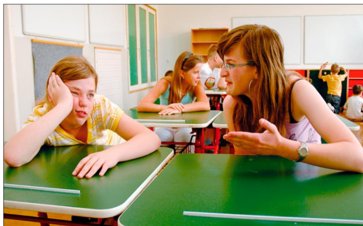
nevhodné chování při hovoru

Úkol: Řekněte, co dělají hovořící lidé na obrázku špatně.