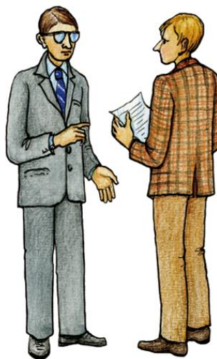
nadřízený a podřízený