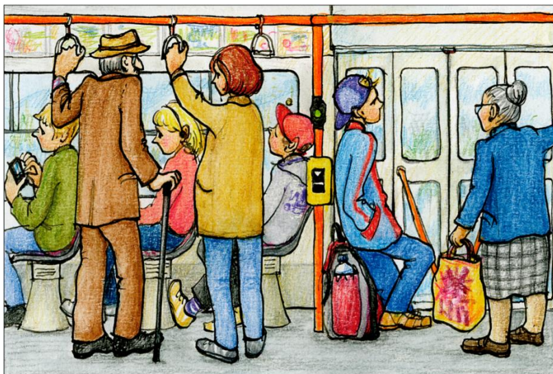
v dopravním prostředku – příklady nevhodného chování

Úkol: Řekněte, jakých prohřešků proti společenskému chování se lidé na obrázku dopouštějí?