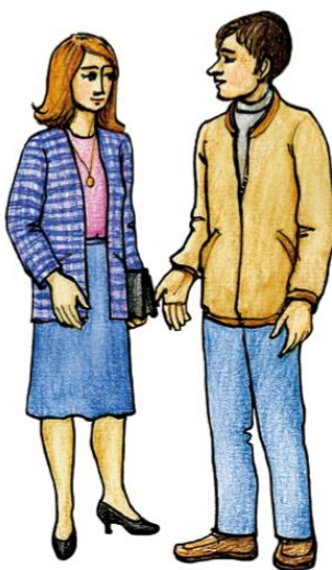
žena a muž