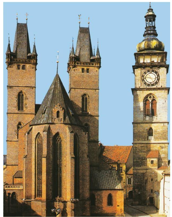
Hradec Králové – gotická katedrála sv. Ducha a barokní Bílá věž (postavena z pískovcových kvádrů)