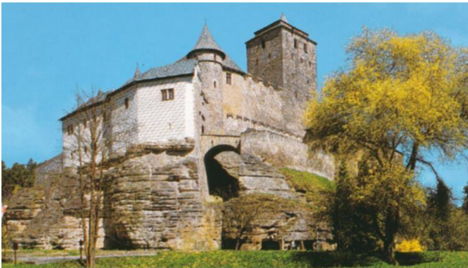
Hrad Kost (CHKO Český ráj) – postavený z pískovcových kvádrů na výběžku pískovcové skály. Je jedním z nejzachovalejších hradů u nás.