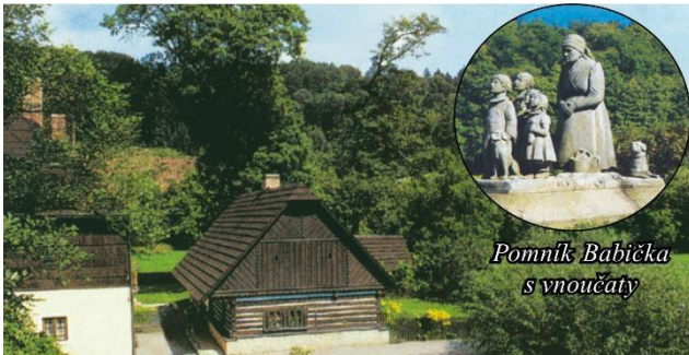
Pomník Babička s vnoučaty