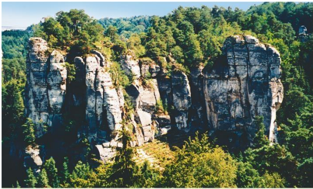
Prachovské skály (CHKO Český ráj). Nejnavštěvovanější „skalní město“ tvořené různě tvarovanými pískovci. Leží nedaleko města Jičín známého z pohádek o loupežníku Rumcajsovi.