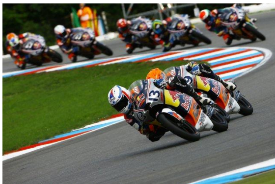
motocyklový závod na Masarykově okruhu v Brně