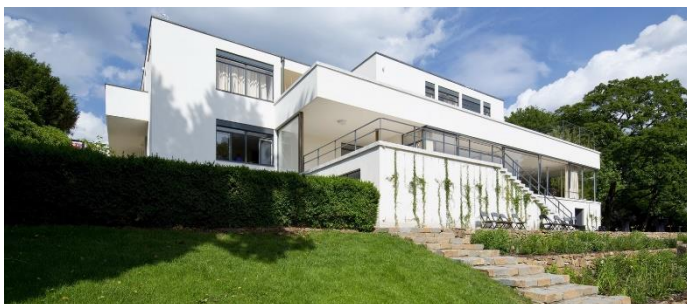
vila Tugendhat (Brno)