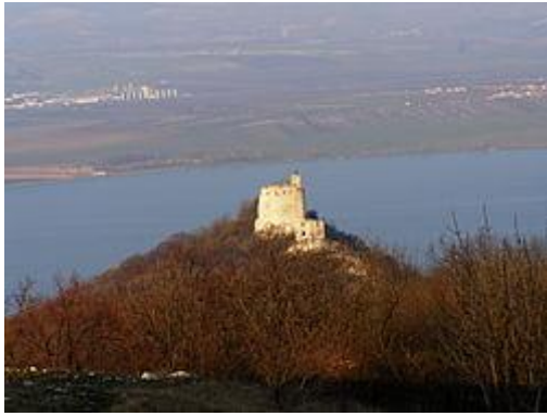
hrad Děvičky (Pavlovské vrchy)