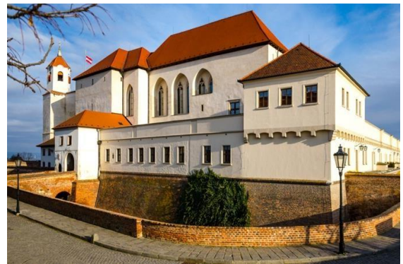
hrad Špilberk (Brno)