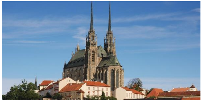
katedrála sv. Petra a Pavla v Brně