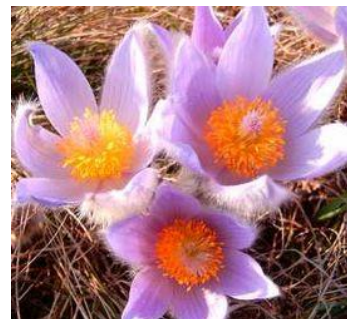
koniklec velkokvětý (NP Podyjí)