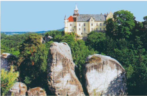
Hrubá Skála – renesanční zámek postavený na vrcholu pískovcové skály v oblasti zvané Hruboskalsko (CHKO Český ráj)