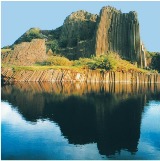
Panská skála u Kamenického Šenova (CHKO České středohoří). Je to čedičová skála, která se sloupovitě rozpadla a vytvořila útvar lidově zvaný „varhany“.