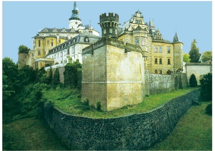
Frýdlant – zámek, v jehož stavbě jsou spojeny prvky středověkého hradu a renesančního zámku