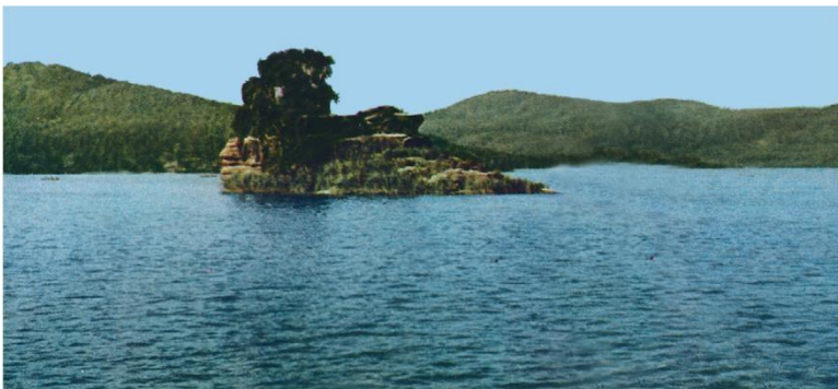
Máchovo jezero (náš nejhlubší rybník). Je pojmenováno podle básníka Karla Hynka Máchy.