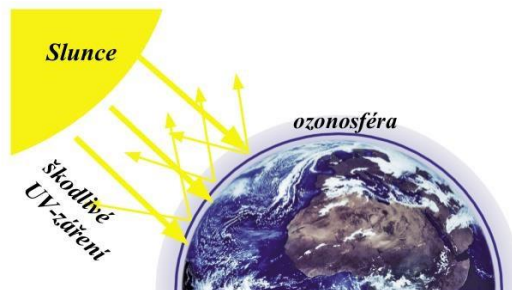
Ozonoféra nás chrání před škodlivým UV-zářením