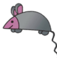
mouse - myš